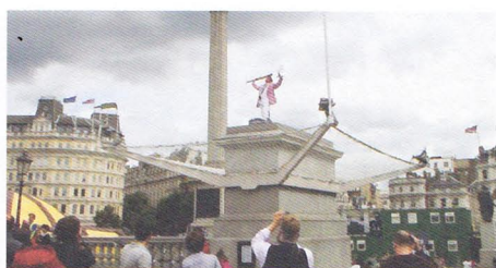
右/アントニー・ゴームリー (Antony Gormley) 《One & Other》(2009) The Mayor's Fourth Plinth Commission, Trafalgar Square, London © Antony Gormley 左/ジャネット・エッチェルマン (Janet Echelman) 《As If It Were Already Here》(2015) Photo: Melissa Henry © Studio Echelman